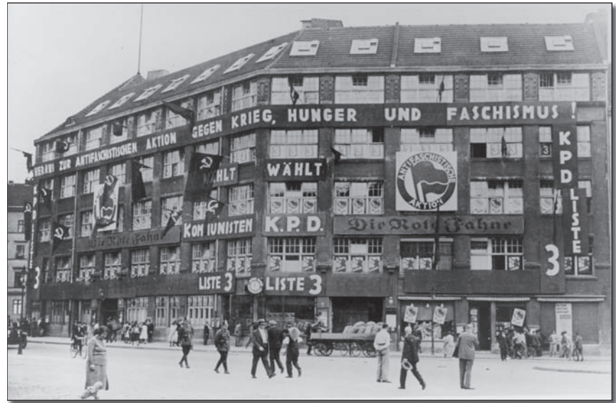
■ Zentrale des Widerstands? Karl-Liebknecht-Haus der KPD (Kommunistischen Partei Deutschlands), Berlin, Ende 1932

45 sehen werden, dass die parlamentarische Demo-